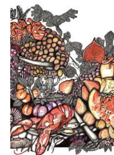
Bella Italia 50 x 70 cm s okvirom (isječak) kemijska olovka na papiru i akvarel

Izložbe (isječak): 2016. Los Angeles, Schindler House, West Hollywood 2015. Graz, izložba, Wirtschaftsbund 2015. Graz, Zusammenarbeit & Ausstellung, Deftbox Marketing, Rockstars festival 2015. Philadelphia, otvorenje Rooberts Rooma 2014. Graz, otvorenje Venier's Elemente Loungea