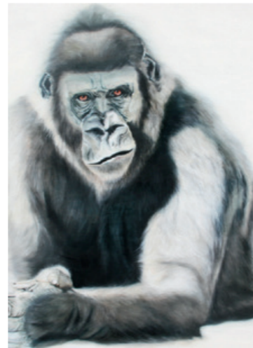
Gorila , 150 x 150 cm uljane boje na platnu

Od 1995. samostalno stvara kao samouka slikarica. „Umjetnik/umjetnica biti – stanje je koje jest. Ili nije!“ Od 1991. održala brojne izložbe u Austriji i inozemstvu te mnoge javne aukcije.