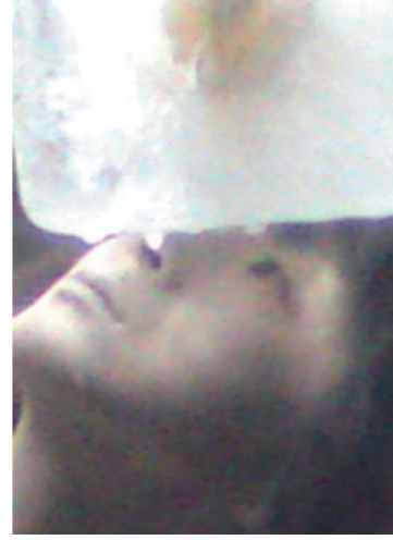
Ples tame 1 , 80 x 60 cm (isječak) fotografija, diptih Ultra SecM – muzejsko staklo – C-print