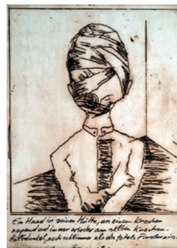
Kaspar Hauser , 54 x 38 cm oslikana poema u deset dijelova; bakropis, litografija Izdanje 30., potpisano i numerirano