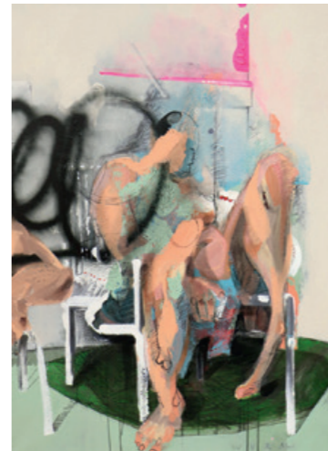
O.T. , 100 x 80 cm akril na platnu

maski, neba i ljudskoga mesa kao da su jedno te isto. Prokapa lijepe iznutrice svijeta i ne opterećuje se pretjerano stvarnošću.“ (Valerie Fritsch, isječak)