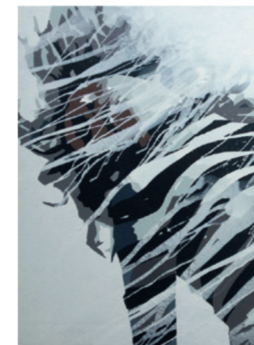
Zebra , 90 x 130 cm akril na platnu

„Izložene su slike odraz mogega umjetničkog djelovanja – usmjerenoga na realnost, ali drugačijega u prezentaciji. Umjetnost mogega slikarstva odnosno sadržaj mojih slika nastaje na temelju vanjskih utjecaja koje obrađujem prema svom nazoru. Često sadržaj mojih radova određuje dominacija jedne boje. Oduvijek sam se suprotstavljao grafičkim šablonskim elementima na način da ih slikovno kombiniram.“