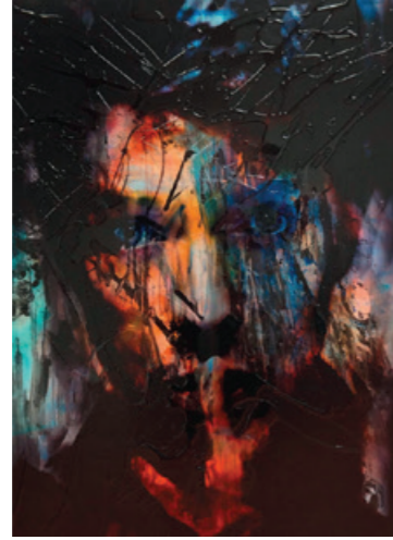
Be Quiet , 160 x 140 cm akril-collagen-airbrush, kombinirana tehnika na platnu

1989. – 1992. školovanje slikarskog usmjerenja na HTBLA, Linz. 1993. – 1994. Fakultet primijenjenih umjetnosti, Beč. 1995. – 1998. Akademija likovne umjetnosti, Prag. 1985. – 2000. istodobno radi i kao međunarodni fotomodel. 2001. – 2005. usavršava slikanje akrilnim bojama, uz primjenu različitih tehnika slikanja, posebice collagen i multimedia art.