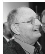
Günter Brus Rođen 1938. u Ardingu.

Samostalne i grupne izložbe u Austriji, Njemačkoj, Mađarskoj, Poljskoj, Italiji i SAD-u. 1991. organizator Weizer Kulturtage – Dana kulture u Weizu. 1993. voditelj ELIN – Ljetne akademije za likovnu umjetnost. 2005. voditelj međunarodne umjetničke radionice u Weizu. Sudjelovanje u internatu. Umjetnički simpoziji u Njemačkoj, Mađarskoj, Poljskoj, Španjolskoj, Austriji.