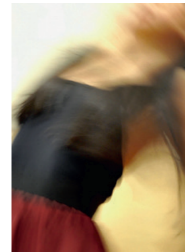
Dance , 80 x 80 cm fotografija na platnu

Umjetnost Anite Buchgraber izvire iz nje same. Fotografija i slikarstvo ekspresija su i kreativan jezik njezine percepcije. Odras su onoga što umjetnica vidi, čime se bavi i što je nadahnjuje. Svako djelo krije jednu poruku – transformiranu iz njezina unutrašnjeg svijeta osjećaja – ili stav o socijalno ili vremenski kritičnim temama.