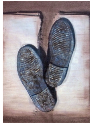
229_OT_11 , oko 30 x 75 cm (isječak) pastel, ugljen, olovka / papir, karton ili papir na kartonu

Studirao dizajn i povijest umjetnosti u Firenci. Akademsku izobrazbu upotpunjuje višegodišnjim boravkom u Švicarskoj i SAD-u. Uspješno je na poziv realizirao projekte za Museum Exploratorium u San Franciscu i za Carl Djerassi Art Program. Taj se umjetnik bavi društvenom i osobnom amnezijom. Dijeceza Graz-Seck naručila je od njega umjetničko uređenje Taborkirche (crkve) u Weizu, a trenutačno je, među